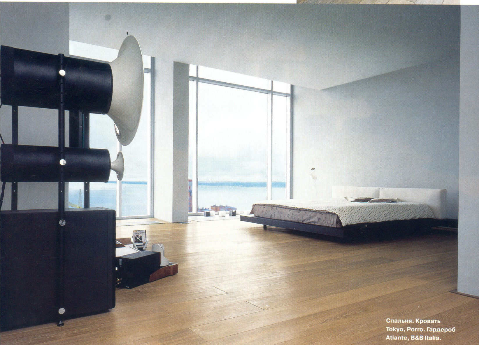
Спальня. Кровать Tokyo, Porro. Гардероб Atlante, B&B Italia.