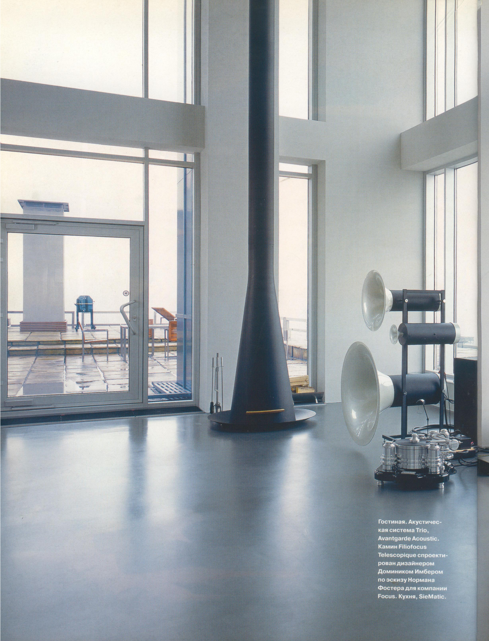
Гостиная. Акустическая система Trio, Avantgarde Acoustic. Камин Filiofocus Telescopique спроектирован дизайнером Домиником Имбером по эскизу Нормана Фостера для компании Focus. Кухня, SieMatic.