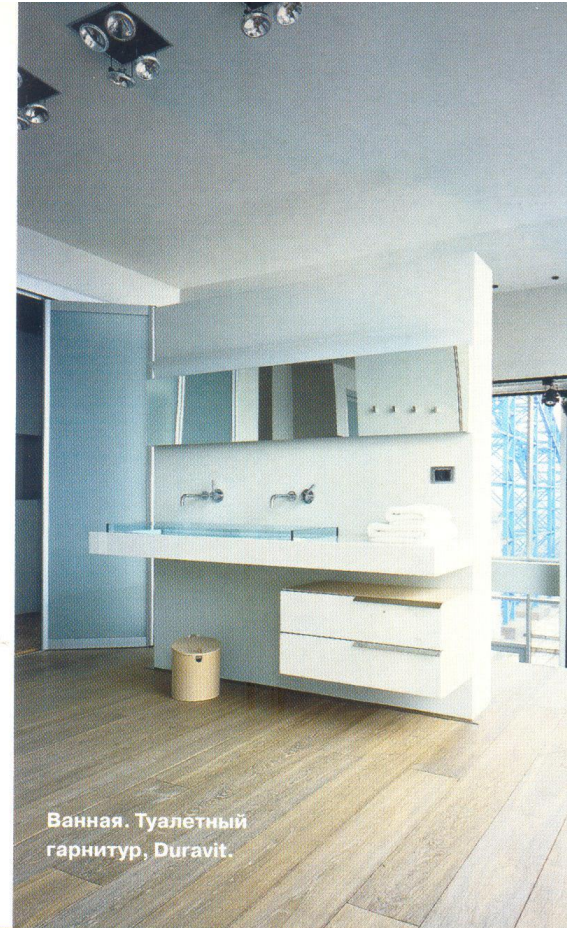
Ванная. Туалетный гарнитур, Duravit.

«Доволен заказчик своим жильем?» – спрашиваю я архитектора. «Он говорит – ну вот, я наконец все построил, все хорошо... Значит, пора продавать». В каждой шутке есть толика жизненной позиции. Промежуточная высота достигнута, пора сниматься с лагеря и идти дальше. Вперед и вверх. ■