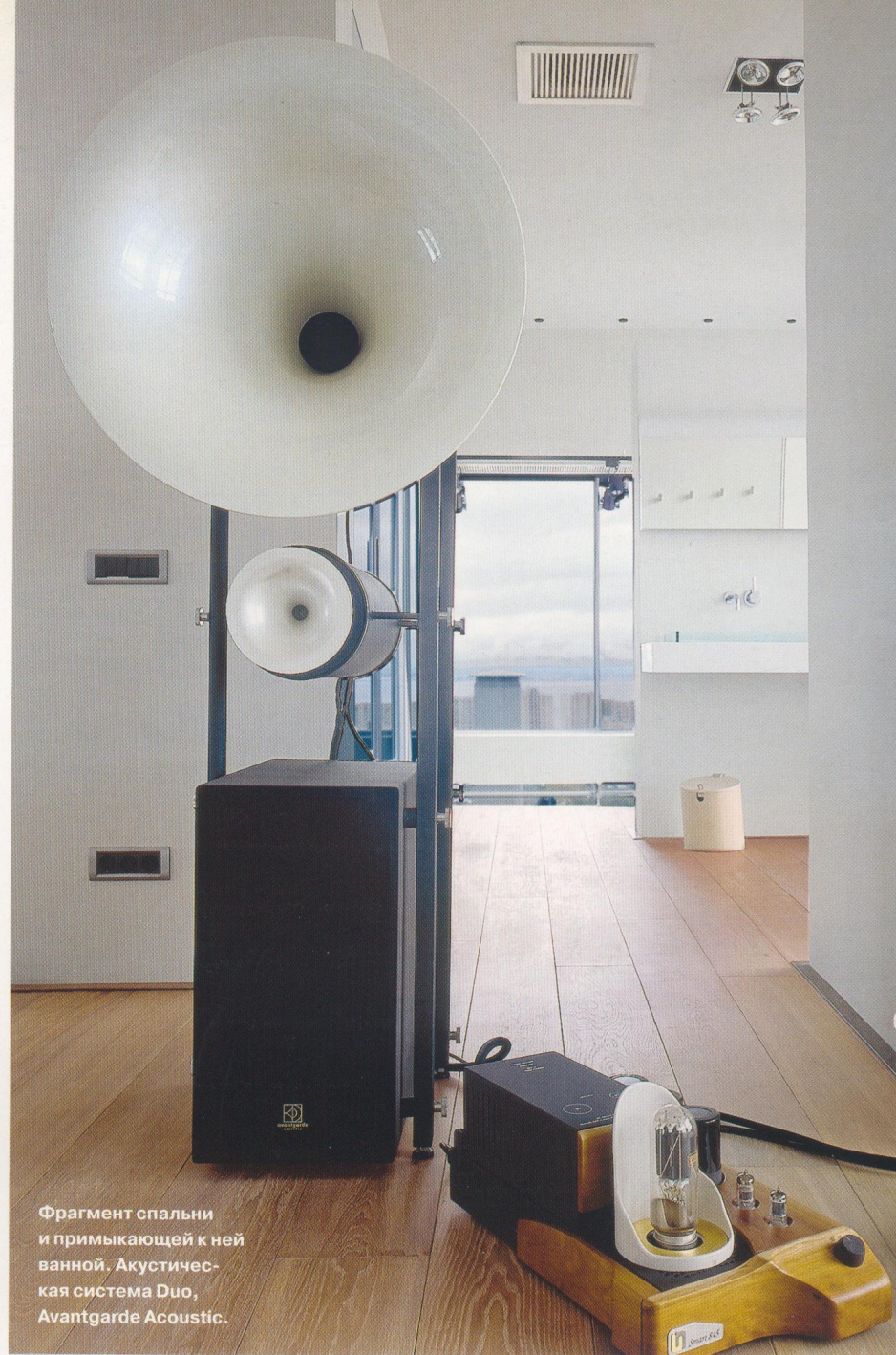
Фрагмент спальни и примыкающей к ней ванной. Акустическая система Duo, Avantgarde Acoustic.

Вопреки ожиданиям, в интерьере не обнаруживается никакой квазиромантической атрибутики: никаких моделей яхт, штурвалов или альпенштоков. Только группа специальных тренажеров, со временем вытеснившая какие-то более житейские вещи. По словам архитектора, эволюция этого интерьера вообще исключение из правил. Если обычно по мере обустройства квартиры зарастают вещами, то здесь все было наоборот. Сначала хозяин решил не устанавливать ванну, запланированную при спальне на втором этаже — довольно и душевой кабины. Потом из гостиной бесследно исчез роскошный диван белой кожи, его заменили два скромных кресла. Видимо, и то, и другое владелец счел сибаритством, несовместимым с его >